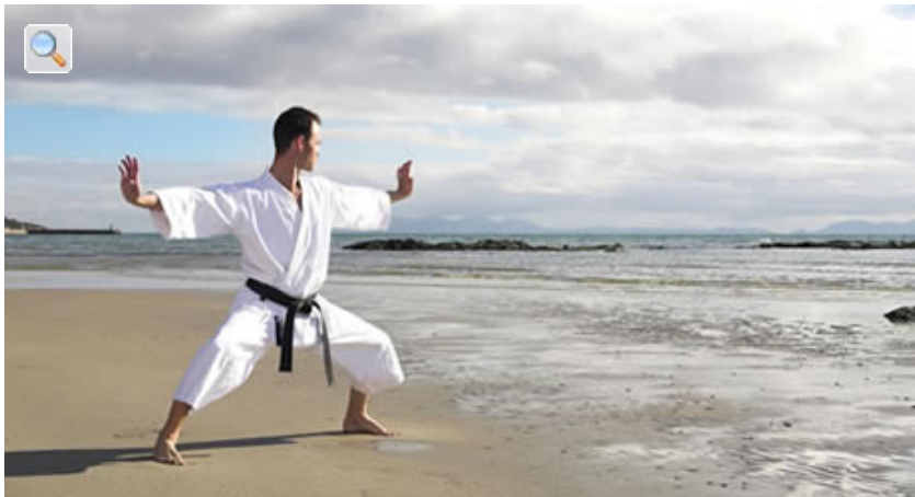
Karate: gesundes Ganzkörpertraining, das wenig mit den Kino-Klischees zu tun hat

Der Breitensport Karate trainiert Kraft, Ausdauer, Konzentration und Balance – und steigert Selbstbewusstsein und Belastbarkeit. Unsere neue Kooperation mit dem Deutschen Karate Verband