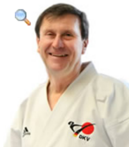
Wolfgang Weigert, Präsident des Deutschen Karate Verbandes

Die intensive Selbstwahrnehmung und den Gleichgewichtssinn schulen; diese Lektionen werden beim Karate groß geschrieben. „Wir erleben oft, dass Schulkinder sich schwer tun, längere Zeit auf einem Bein zu stehen, um einen Fußstoß auszuführen. Da ist es natürlich wichtig, erst mal das Ausbalancieren zu üben“, berichtet Fritzsche. „Auch ältere Menschen profitieren vom Gleichgewichtstraining, um Stürzen im Alltag vorzubeugen.“ Eine gute Möglichkeit ist es dann, Tritte oder Schläge in Zeitlupe durchzuführen, das fördert Präzision und Kraft. Im übertragenen Sinn kann das Üben, festen Halt auf dem Boden zu haben, natürlich auch die Psyche positiv beeinflussen. „Das stärkt auch das Selbstbewusstsein, schenkt Sicherheit und Vertrauen“, sagt Weigert. Außerdem wird grundsätzlich Wert auf tiefe Zwerchfellatmung statt flacher Pressatmung gelegt, eine Technik, die ebenfalls entspannt und Stress reduziert.